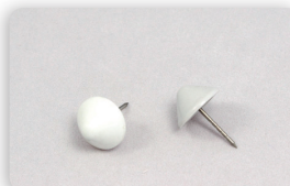
SI5 RIP PIN Zubehör für alle Tags