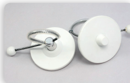
SI5M BO TAG RF geeignet für: Flaschen