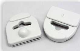
SI5M BLI TAG RF geeignet für: Blister- Verpackungen