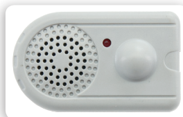
SI5M 3AL TAG RF geeignet für: Kleider, Taschen