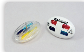
SI5 COL PIN Zubehör für alle Tags Tinte: blau, gelb Gehäuse: weiss Dimensionen: 42x28 mm