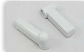
SI5M PEN TAG RF geeignet für: Kleider, Jacken