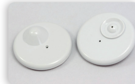
SI5M RO50 TAG RF geeignet für: Kleider, Taschen