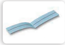
SI4 METO1 SI4 METO2