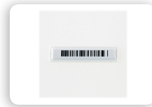
SI4 UMAX1 SI4 UMAX1-3